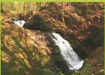
Akvofaloj: natura kaj artefarita (ĉe la paperfabriko)