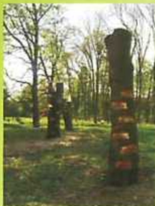
Grimp-arboj en la parko