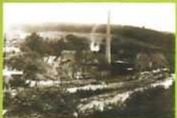
Utiligo de akvoforto