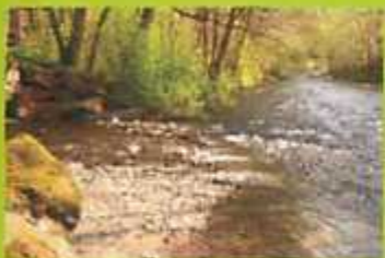
Sieber kaj Lonau: naturaj riveroj

Mueleja kanaletoj: artefarita akvofluejo