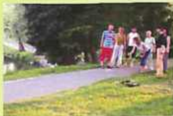
„Boule” glob-ludado ĉe la Jues-lago