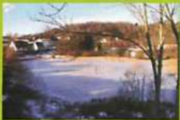
Jues-lago kaj Ochsenpfuhl: ter-enfalaj lagojetoj