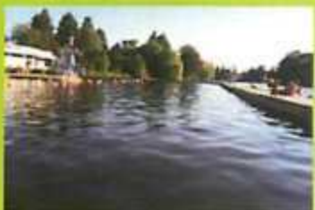
Naĝado en la Jues-lago